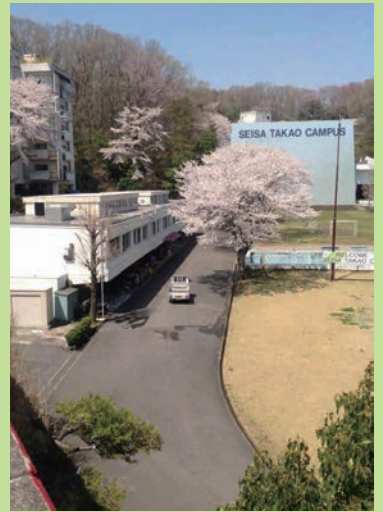
春の星槎高尾キャンパス (3号館からの眺め)